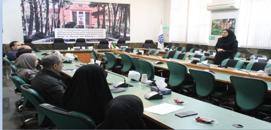
کارگاه صیانت از حقوق شهروندی

دانشده پرستاری و مامایی دانشگاه علوم پزشکی تهران