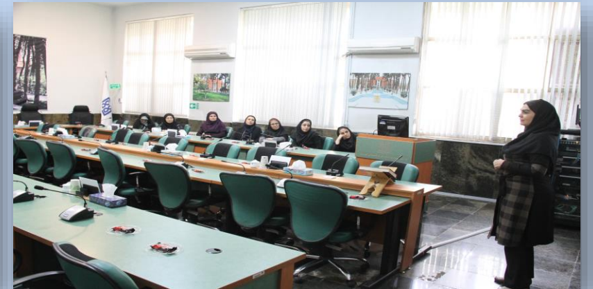
کارگاه آموزشی «آشنایی با فرآیند شکل گیری الگوهای ذهنی (طرحواه ها) "من پشت پرده ما کیست؟"