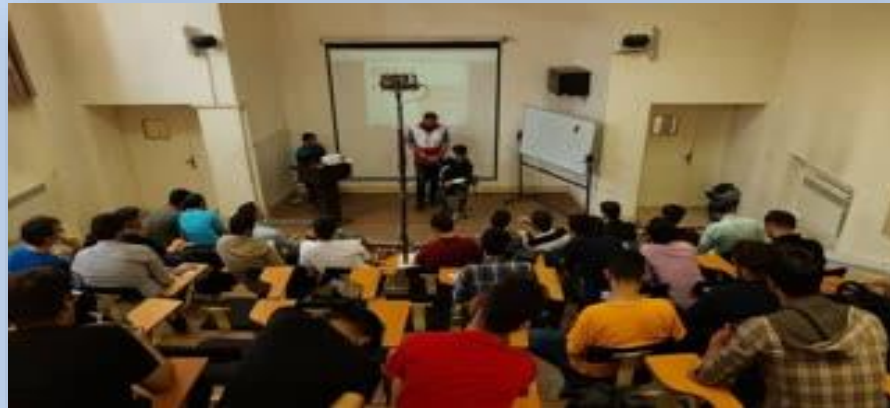
کارگاه کمک های اولیه