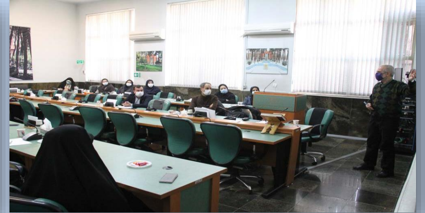
سلسله کارگاههای معرفت نفس